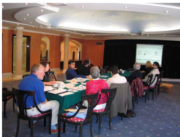
Από τη συνάντηση της ομάδας εργασίας στη Ρόδο.

B. Η δημιουργία και στήριξη του Δικτύου Εργοδοτών κατά των Διακρίσεων.